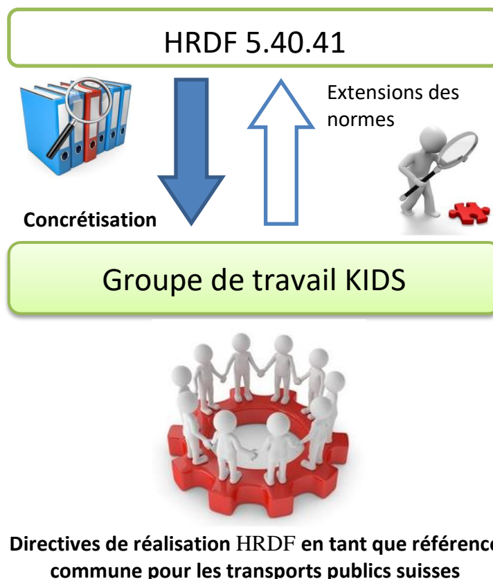
Figure 1 : Relations entre KIDS et HRDF

Il décrit les perspectives concrètes, ainsi que les divergences par rapport à la référence (norme HRDF [1]), l'objectif étant de garantir une application uniforme dans tous les transports publics suisses.