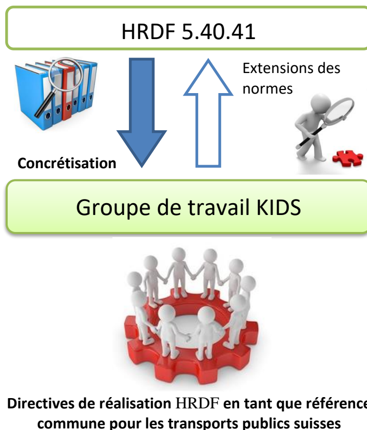
Figure 1 : Relations entre KIDS et HRDF

Il décrit les perspectives concrètes, ainsi que les divergences par rapport à la référence (norme HRDF [1]), l'objectif étant de garantir une application uniforme dans tous les transports publics suisses.