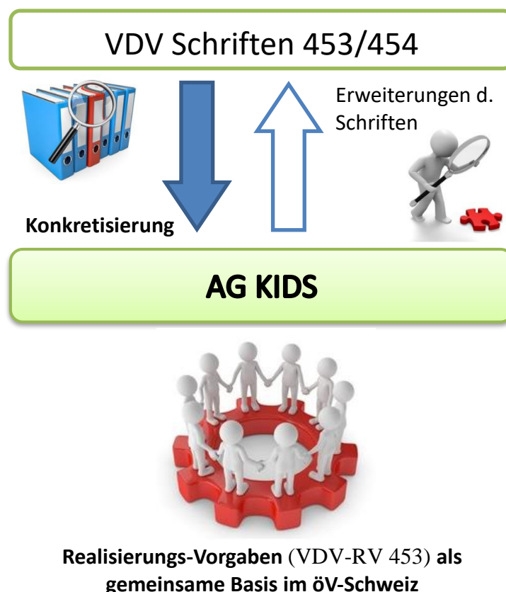
Abbildung 1: Zusammenhang KIDS und VDV.

Dabei handelt es sich um Konkretisierungen und Abweichungen zur offiziellen Schrift mit dem Ziel der einheitlichen Anwendung im gesamten öV-Schweiz.