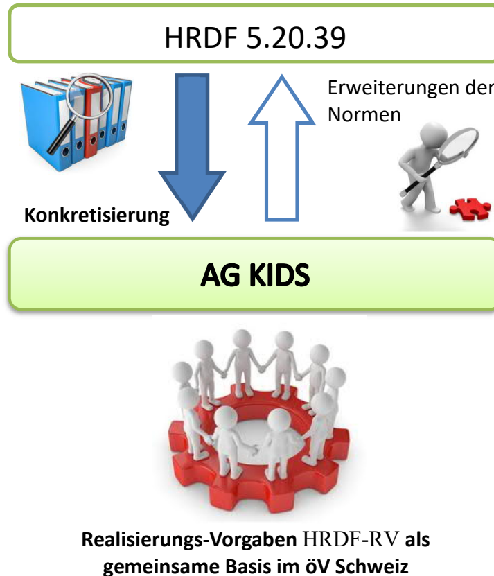
Abbildung 1: Zusammenhang KIDS und VDV.

Dabei handelt es sich um Konkretisierungen und Abweichungen zur Basis (HRDF NORM [1]), mit dem Ziel der einheitlichen Anwendung im gesamten öV Schweiz.